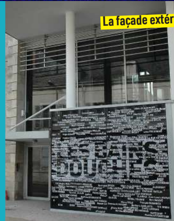
La façade extérieure

Pour les entreprises et les associations un lieu original pour inviter vos collaborateurs à vos assemblées générales, séminaires ou divers évènements !