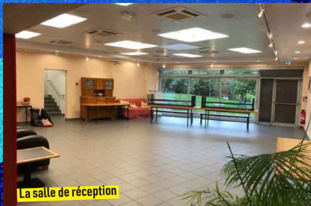
La salle de réception

Les Bains-Douches de Lignières, salle de concert dans le sud Berry, à 45 km au sud de Bourges, propose ses espaces à la location afin d'autofinancer une partie de ses projets culturels.