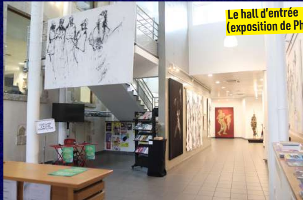
Le hall d'entrée (exposition de Philippe Tallis)